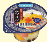
たいまつ食品株式会社 涼味専科 みつめ