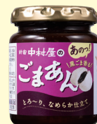
株式会社 中村屋 新宿中村屋のごまあん